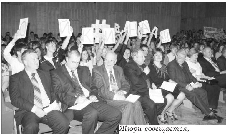
Жюри совещается, болельщики неиствуют

И какой же вечер без приятных сюрпризов?! Его устроили организаторы и администрация любимому коллективу эстрадного танца "Контраст Дэнс", всенародно поздравив руководителя и сам коллектив с 10-летием творческой деятельности. Ура!