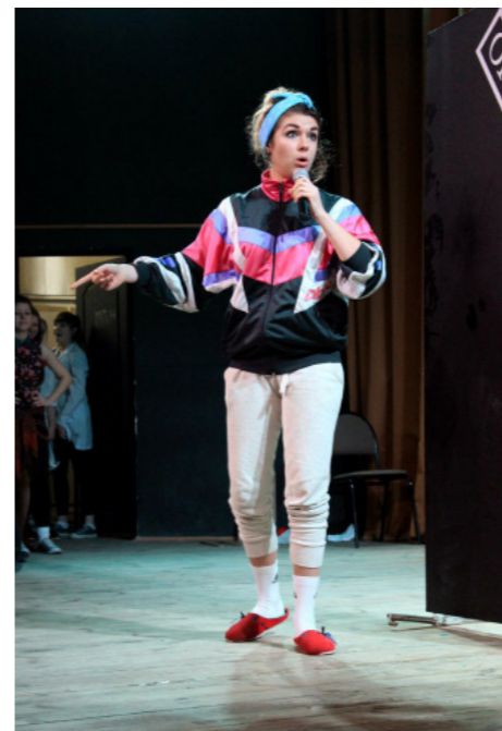
Главная героиня выступления НПМ

Открыть концерт предстояло факультету ХФТ с жанром сказка. «Три девицы под окном» не только пряли ночью, но и веселили публику поисками идеального парня, представителей которого, к сожалению, на факультете и без того не много.