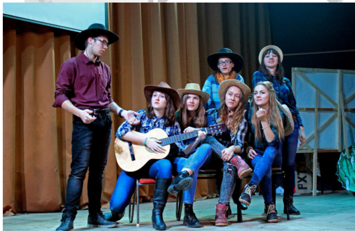
Команда ФИТУ во время выступления

Текст: Екатерина Мищенко, ТНВиВМ, Н-31