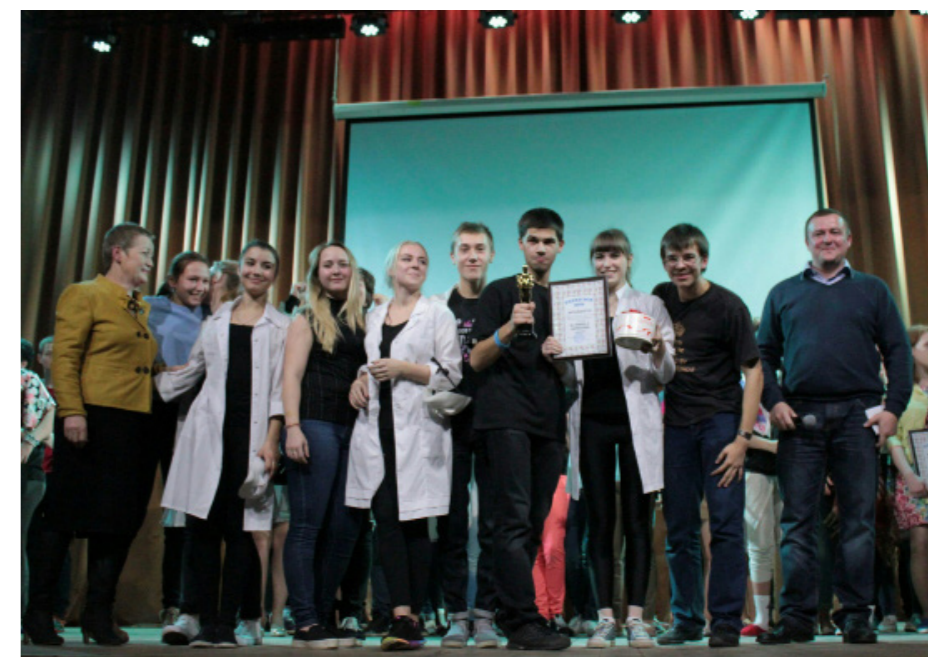
ТНВиВМ, команда победителей

Конкурс «Первачок» наглядно показал, насколько зажигательные и талантливые ребята учатся в нашем вузе, и что РХТУ им. Д. И. Менделеева не зря называют творческим вузом.