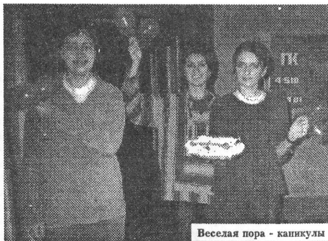
Веселая пора - каникулы