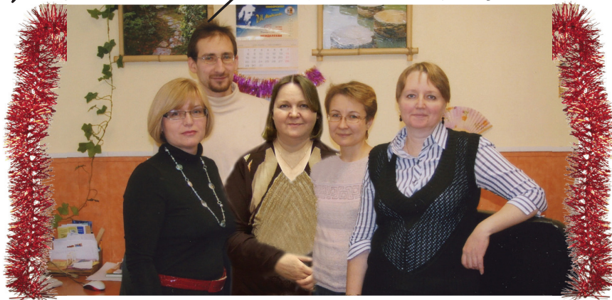
Репортаж, посвященный 10-летию РВЦ, читайте на стр. 4-5

В марафоне лет и буден Вы несете радость людям!