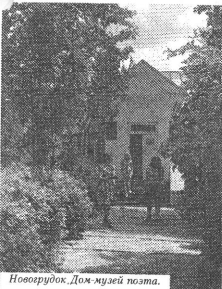
Новогрудок. Дом-музей поэта.

С раннего детства ему был близок также белорусский и литовский люд, он знал обычаи, предания и песни, его горькую долю.