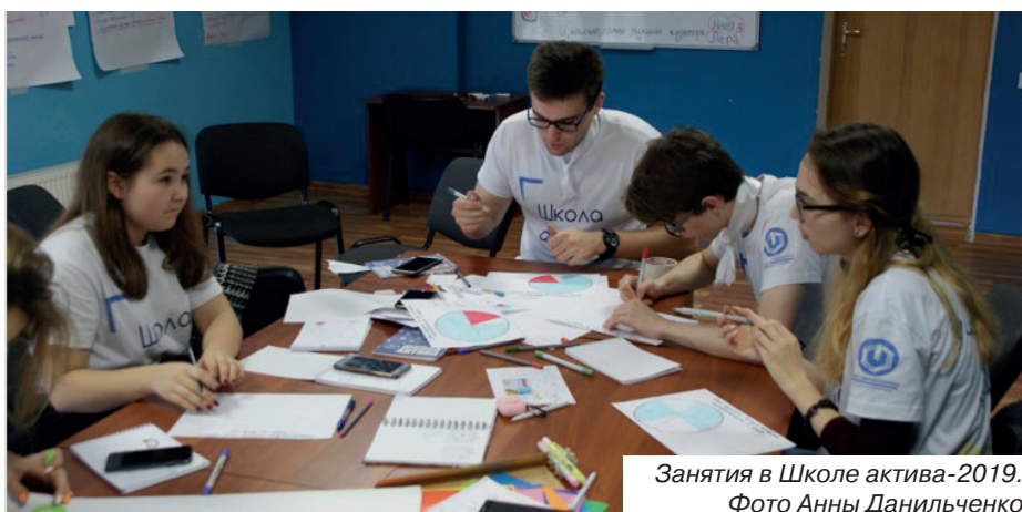
Занятия в Школе актива-2019.