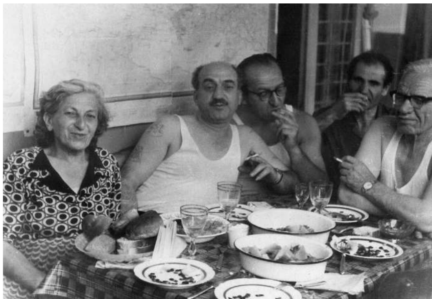
У родителей в Ереване. 1970-е годы