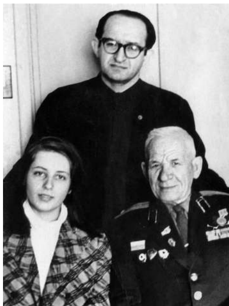
С дочерью и отцом. 1970-е годы

Отец жил отстраненно от семьи, но и самодостаточно, по-Своему, и категорически не позволял вмешиваться в свою жизнь ни в мелочах, ни в важном. Он не позволял мне даже мыть посуду, так как считал, что мой способ мытья чреват заливом нижних соседей (у него же был Свой Правильный Способ). Приходилось мыть тайком, быстро-быстро, и, поскольку текла канализационная труба, иногда я соседей действительно заливала. Событием это было, в прямом смысле слова, страшным... Отец так переживал соседский ущерб и моё самоуправство, так страшно, истошно кричал на меня, что я, не шутя, боялась за его жизнь. У папы в строго определенном месте был неприкосновенный для «растяп, которые всё теряют», строго определенный фонарь, с помощью которого он несколько раз в сутки проверял, не мокро ли под мойкой. Ритуал провер-