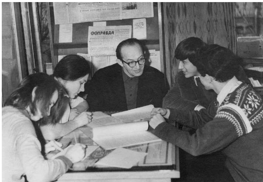
Школа молодого лектора. МХТИ. 1970-е годы