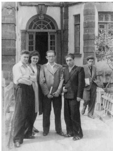
Ереванский педагогический русский институт. 1949 год