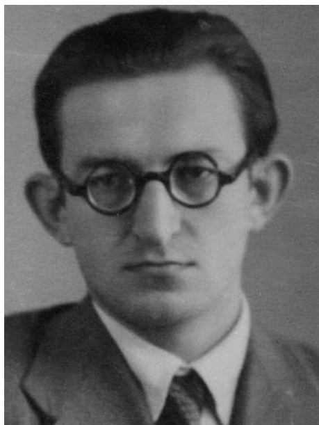
Студент. Кон. 1940-х - нач. 1950-х годов

Мне и нескольким моим товарищам повезло: нас рекомендовали в так называемую Педагогическую аспирантуру при институте истории Академии Наук СССР. Осенью 1949 г. я с друзьями прибыл в Москву. Не подумавши серьезно, я решил заняться проблемами истории Англии и стал членом сектора Новейшей истории. Все приемные экзамены я сдал на 5 и 4.