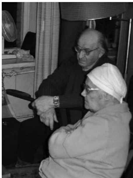
У телевизора. 2000-е годы

Пафоса и позиции ведущих он мог совершенно не разделять, но смотрел из-за фактов. «Он приводит интересные факты», — горячился отец в ответ на мои иронические замечания. Смотрел обязательно научно-документальные фильмы по историческим темам, смотрел и слушал симфонические и эстрадные концерты, оперы и балеты, научно-популярные передачи, классические кинокомедии (обожал Ч. Чаплина, О. Хапберн), некоторые сериалы. Стремясь разобраться в современности, отец смотрел и со-