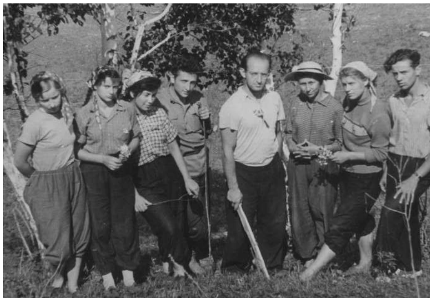
Начальник целинного отряда в Хакасии. 1957 год