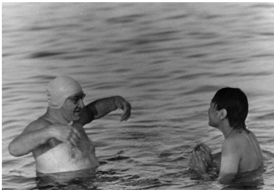
«Буревестник». Урок плавания. 1980-е годы