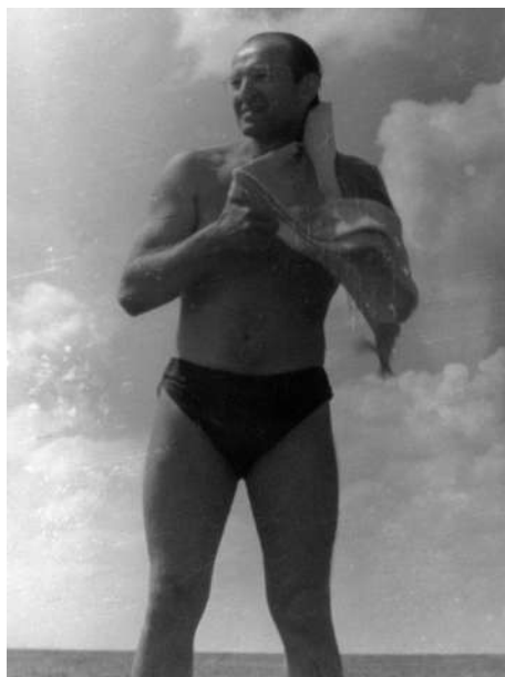
Солнце, воздух и вода. 1958 год

Домашняя жизнь отца не была замкнутой — невозможно замкнуться в малогабаритной квартире со смежными комнатами, но она текла в своем русле, в своем режиме. Режим этот был уникален, точно, что больше никто так «на Москве» не живет. «Сосну-ка я минут сто», — говорил он часов в 10 вечера, если не было интересной передачи по телевизору. Все благоверные, уж коли ложатся часов в 10–11, так уж спят до утра. Не то — у нас! У нас в 23.30 начинается интересная передача, потом отец читает и засыпает