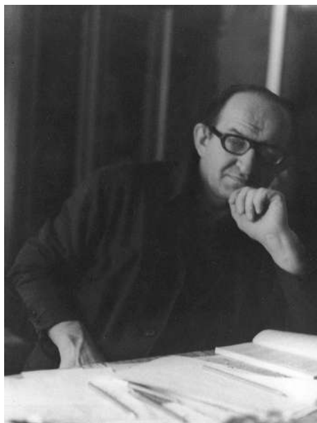
Дома за работой. 1970-е

лу, как всегда при виде новых книг, очень обрадовался, я же сказала, что все это чтиво даже на помойку нельзя выбросить — вдруг кто-нибудь подберет и прочитает. Книги с месяц после этого виновато стояли в ящике, пока однажды, придя с работы, я не застала измученного папув окружении груд рваной бумаги. Много часов он трудился, старый, смертельно больной человек, уничтожая неразумное и недоброе, хоть малую толику его сделал вечным! Наша помойка рядом со школой — папа спасал детей от растрления!!! А,