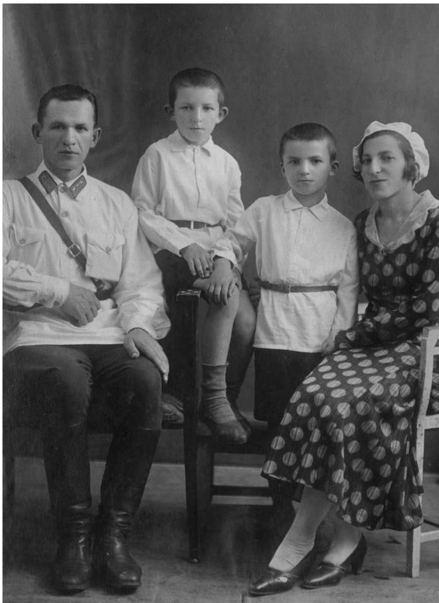
Семья Карловых. 1933 год