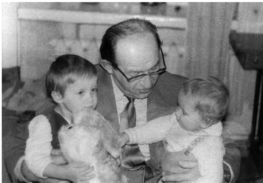
Дедушка и внуки. 1981 год

часа в 4 утра, держа книжку вертикально (книжка никогда не падает). Время от времени отец просыпается и продолжает чтение, свет горит.