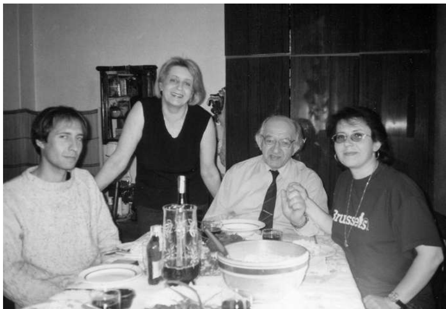
В кругу близких. 1998 год

ветом, то за хозяйственной нуждой, а он то шумел на них, не дававших покою, то вполне разумно и ответственно разрешал их проблемы.