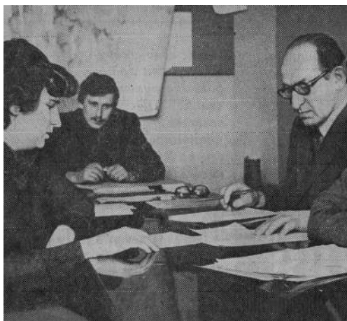
Госэкзамен. 1981 год

Мы считались тогда молодёжью, «отравленной» «оттепелью» 60-х годов. К нам тянулись студенты, но за нами зорко следили «старики». Приходилось накапливать опыт и взрослеть в обстановке подозрительности, недоверия, а порой и открытой недоброжелательности с их стороны.