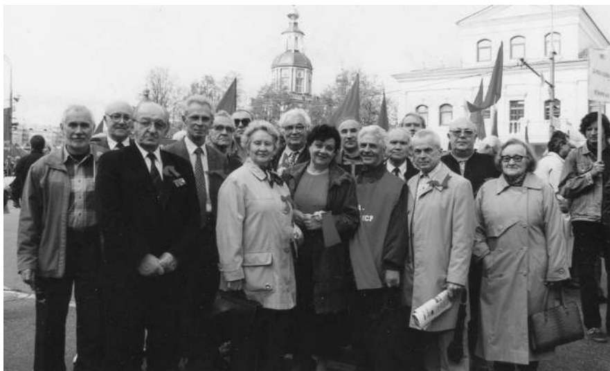
С сотрудниками института 1 мая 2002 года