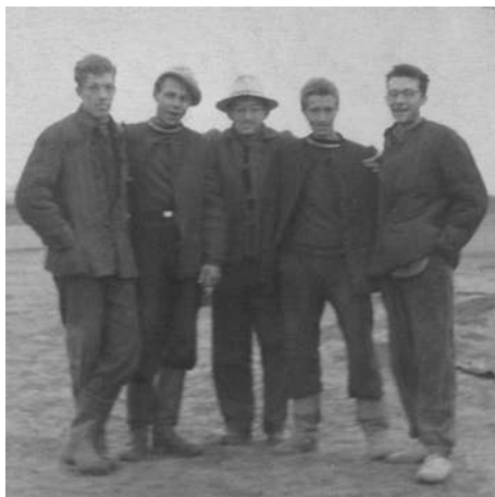
На целине. Акмолинская область. 1958 год